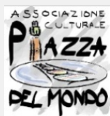
Immagine: Luigi Mengoli